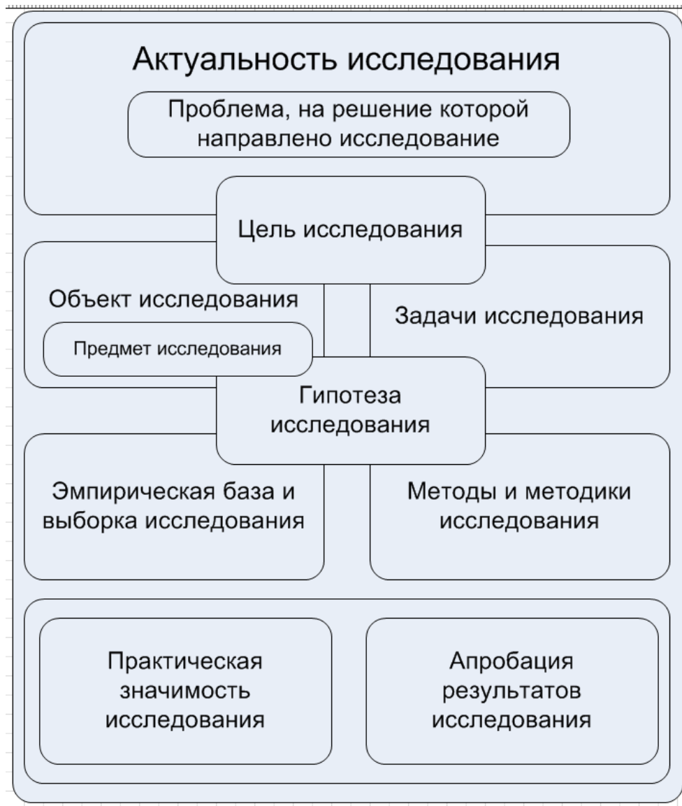
Рисунок 1. Характеристики исследования, требующие описания в Введении к курсовой / выпускной квалификационной работы.

Введение является визитной карточкой работы, поэтому к его написанию подходят особенно вдумчиво. Вместе с тем, нужно понимать, что, несмотря на то, что введение следует сразу после листа оглавления работы, его окончательный вариант получается лишь после оформления всех остальных частей работы. Связано это с тем, что, задумывая работу, мы на самом деле имеем перед собой лишь проект того, что может получиться, поэтому корректировка отдельных фрагментов введения осуществляется на протяжении всей деятельности по реализации проекта написания работы любого уровня.