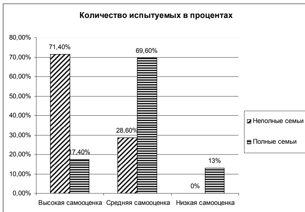
Рисунок 3. Уровень самооценки старших школьников с высокой агрессивностью по методики Т. Дембо и С.Я. Рубинштейн из полных и неполных семей»

«По итогам обработки данных были получены следующие результаты (см. рисунок 3):