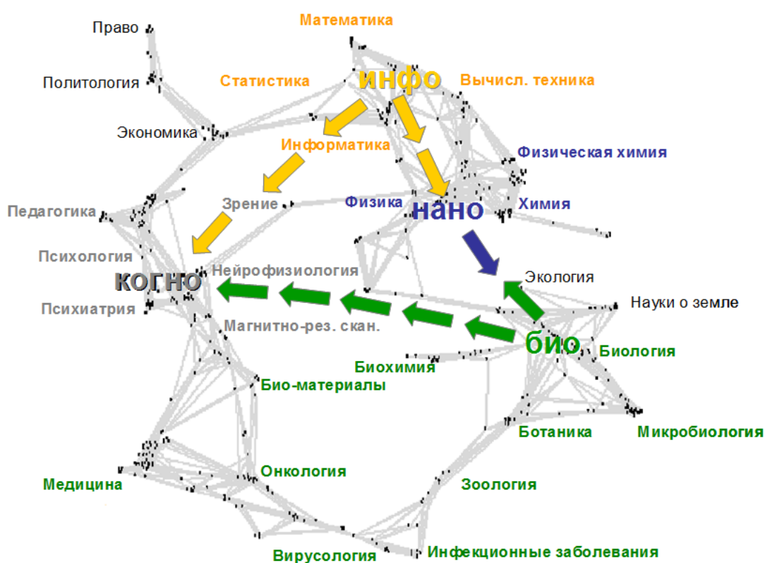
Рис. 1 Карта пересечений новейших технологий

В перспективе видна возможность синтеза белков, выполняющих заданные функции по манипуляции веществом на наноуровне [91]. Были продемонстрированы и обратные возможности, например, модификация формы белковой молекулы с помощью механического воздействия (фиксация «наноскобой»). Нанотехнологии приведут к возникновению и развитию новой отрасли, наномедицины: комплекса технологий, позволяющих управлять биологическими процессами на молекулярном уровне.