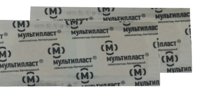
Полоски лейкопластыря (4 шт.)