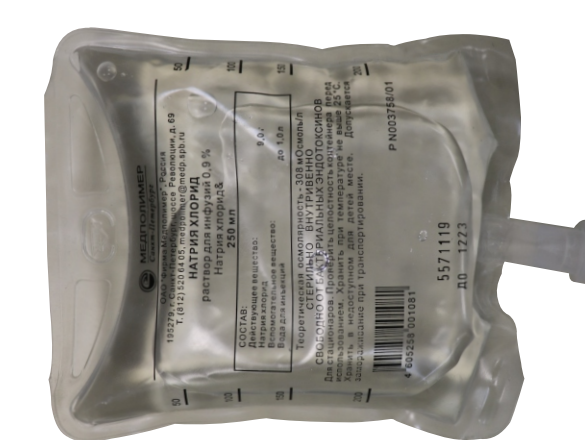
Раствор NaCl - 0,9 % 250 мл (1 шт.)

для восполнения объема крови при массивном кровотечении