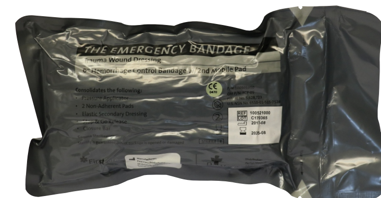
Компрессионная полевая повязка 6" (Израиль)