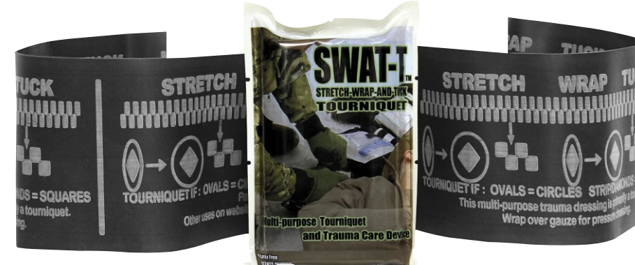
Жгут «SWAT-T» (США)

МИНИМАЛЬНЫЙ КОМПЛЕКТ аптечки («боевая триада»)