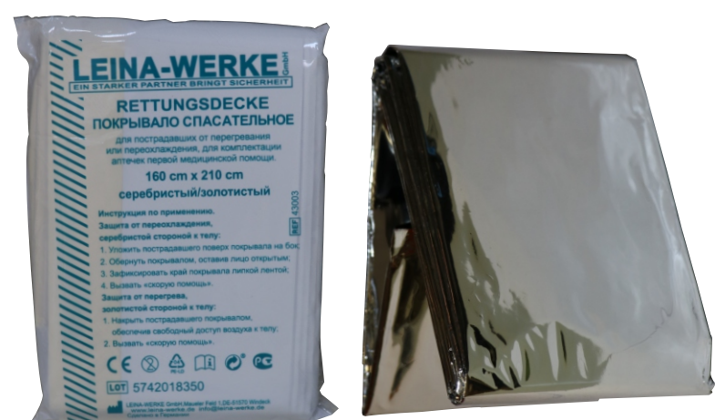
Термоодеяло (1 шт.)