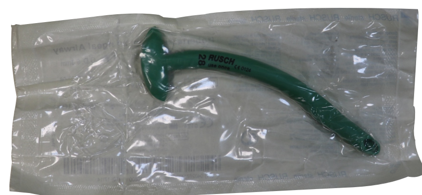
Назофарингеальный воздуховод (Малайзия) (1 шт.)