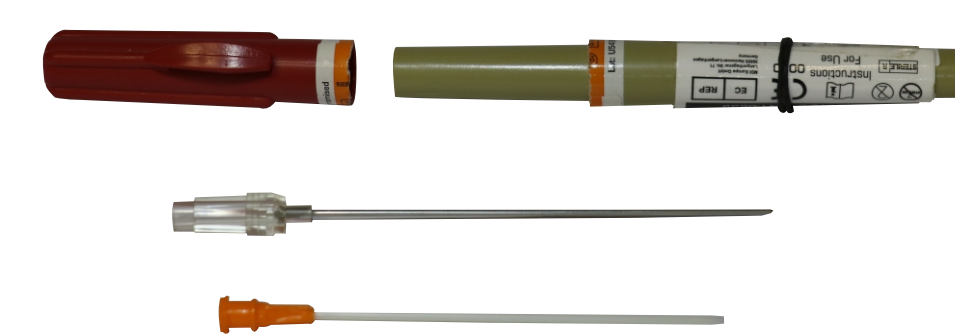
ARS Needle Decompression Kit (США)