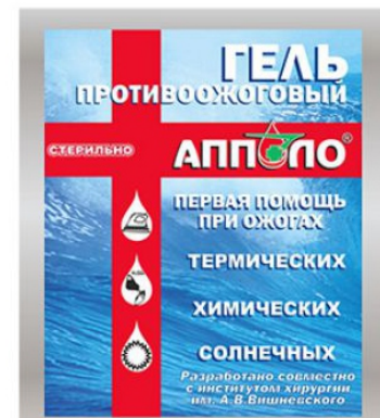
Противоожоговый гель (1 шт.)