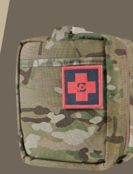
Подсумок медицинский «Stitch Profi»