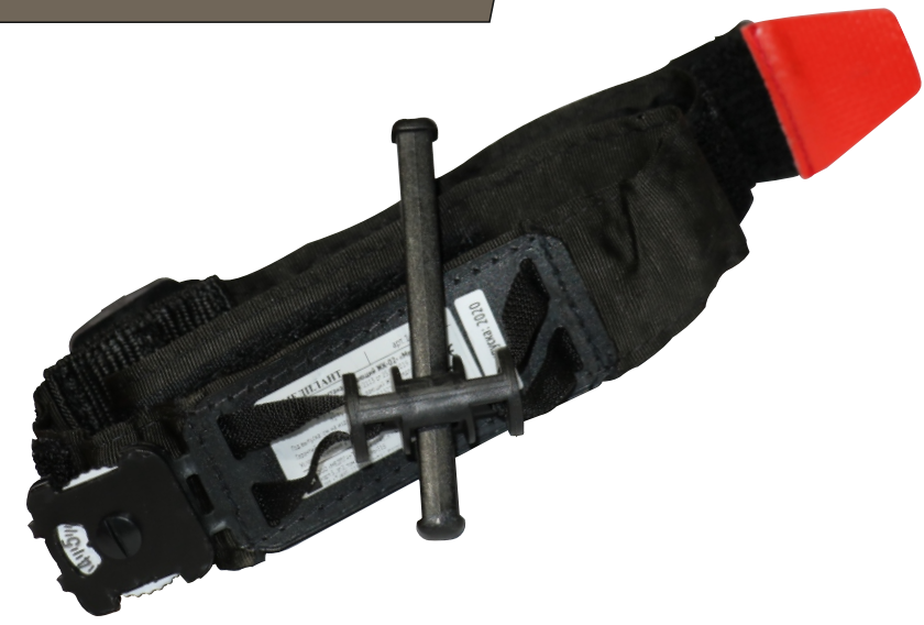
«Медплант» ЖК -02