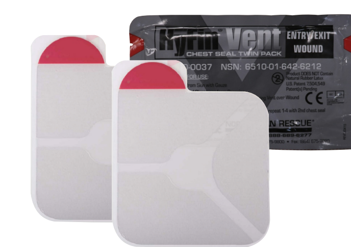
HyFin Vent Chest Seal (США) (есть выпускной клапан)