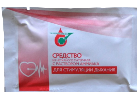
Салфетка для стимуляции дыхания (1 шт.)