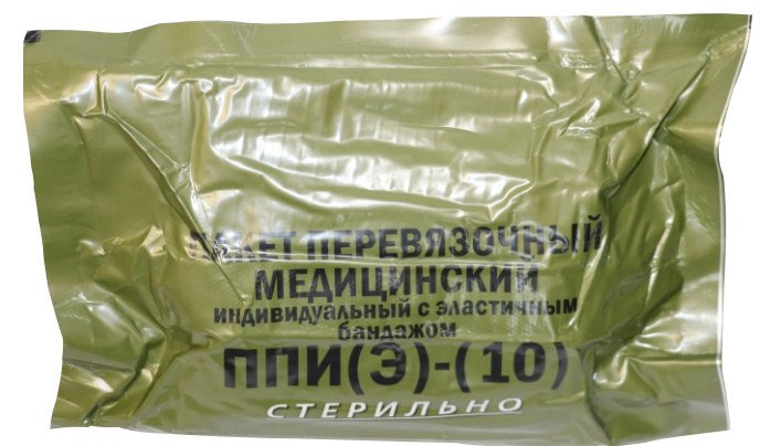
ППИ (Э)-10 «Апполо»