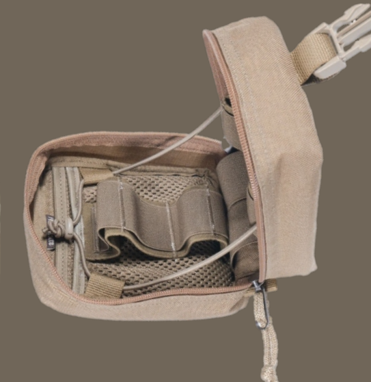
Подсумок медицинский «Garsing» UP-103