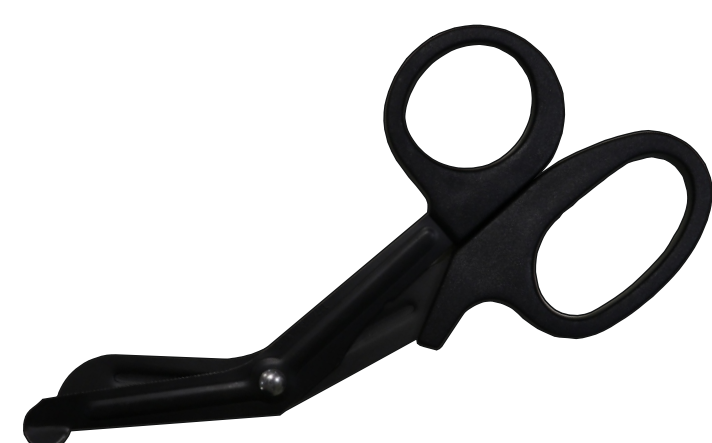
Ножницы тактические (1 шт.)