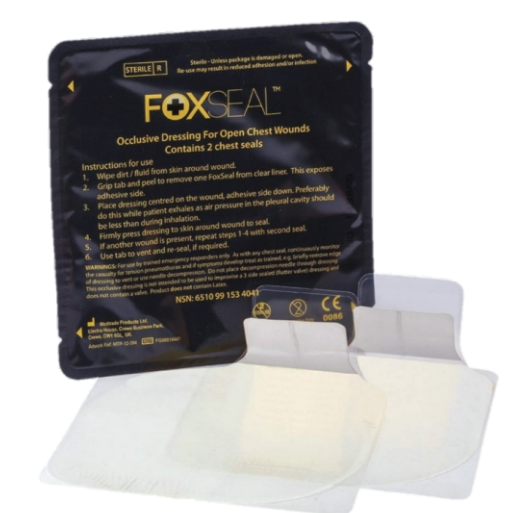
Fox Chest Seal (США) (нет выпускного клапана)

для герметичного закрытия ранений грудной клетки