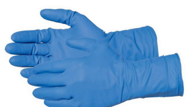
Перчатки медицинские (1 пара)